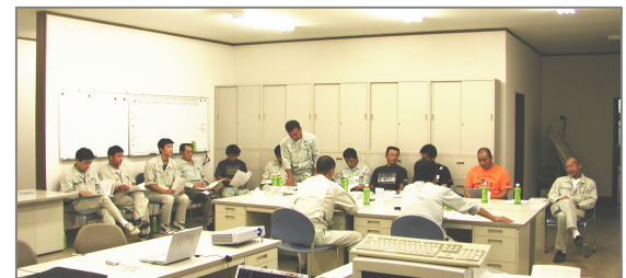
内部監査向上委員長の発表