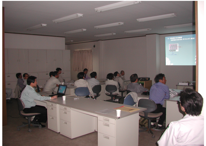
コンクリートの材料についての講演